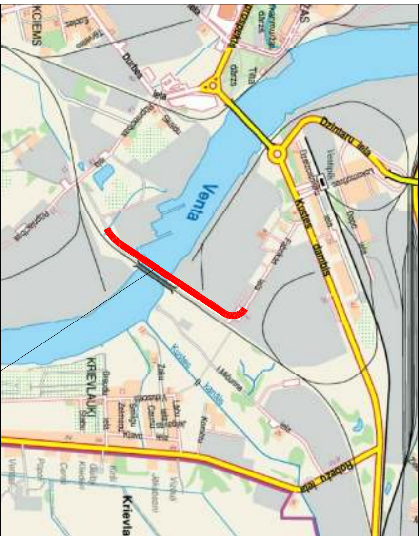
Projektējamais objekts Designed object